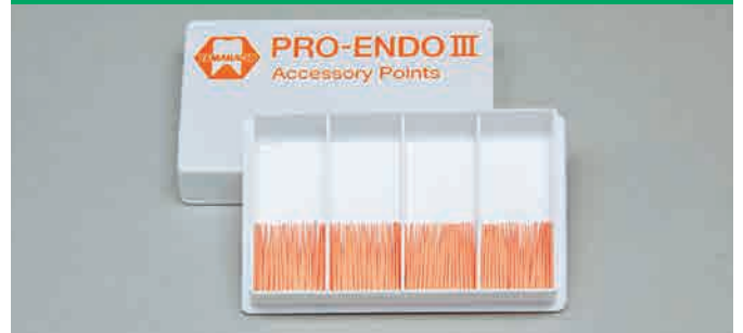
■形態表 アクセサリポイント