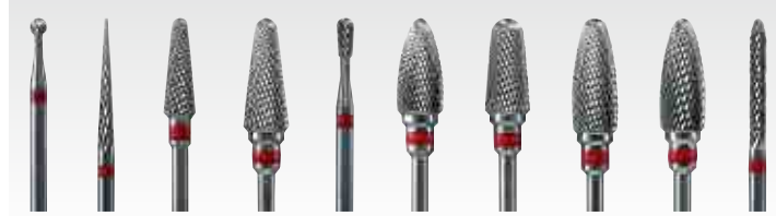
F-1 F-2 F-3 F-4 F-5 F-6 F-7 F-8 F-9 F-10