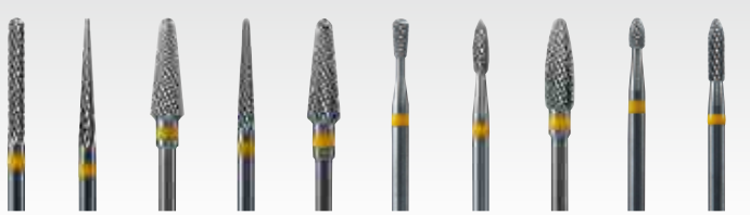
SF-1 SF-2 SF-3 SF-4 SF-5 SF-6 SF-7 SF-8 SF-9 SF-10