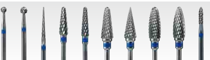
M-1 M-2 M-3 M-4 M-5 M-6 M-7 M-8 M-9 M-10