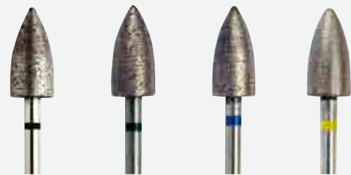
粗い ← → 細かい エクストラコース コース ミディアム エクストラファイン

ダイヤモンド砥粒と金属粉を内部まで焼結しているため、長期間にわたり高い切削力を維持します。