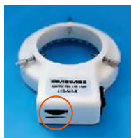
光量調整ダイヤル